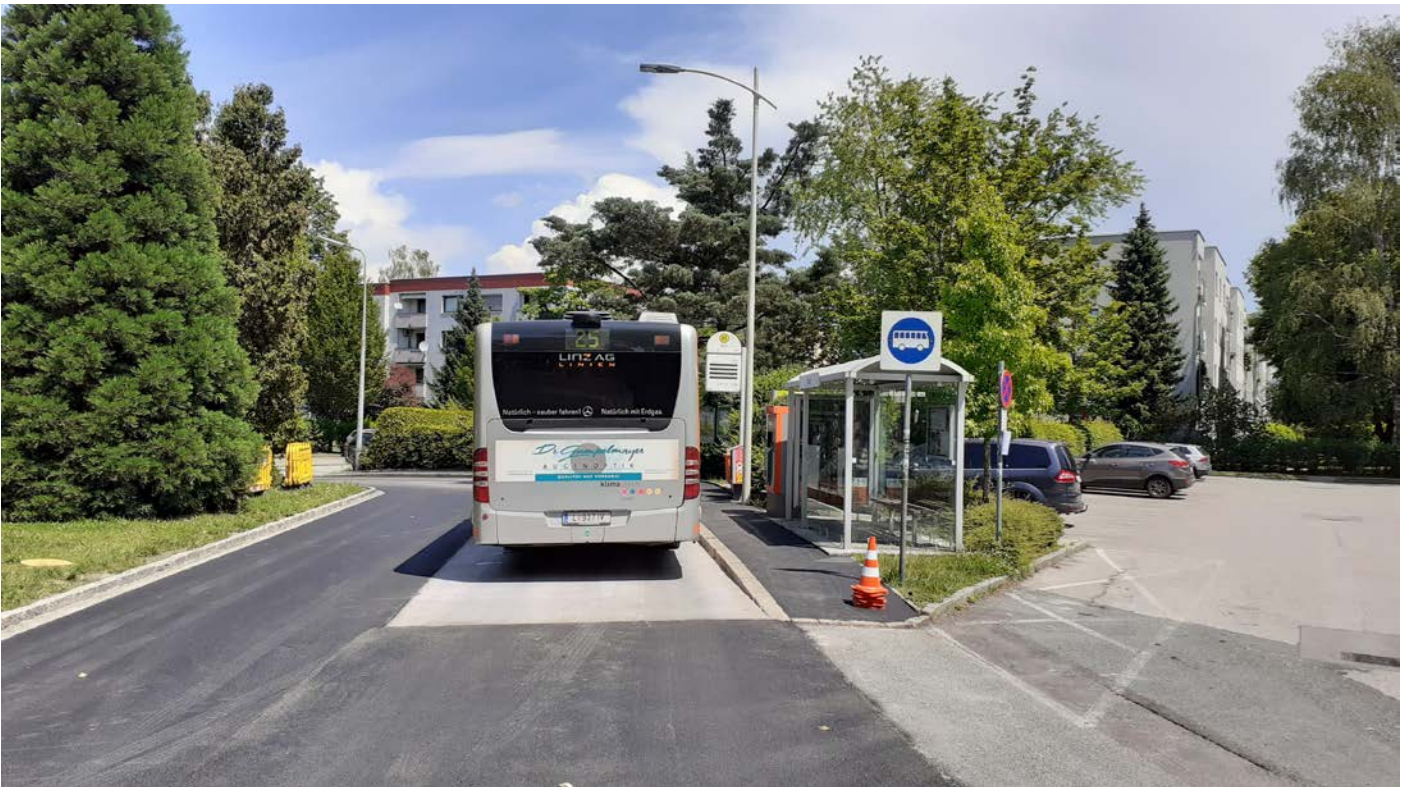
Neue Deckschicht / Endhaltestelle Linie 25