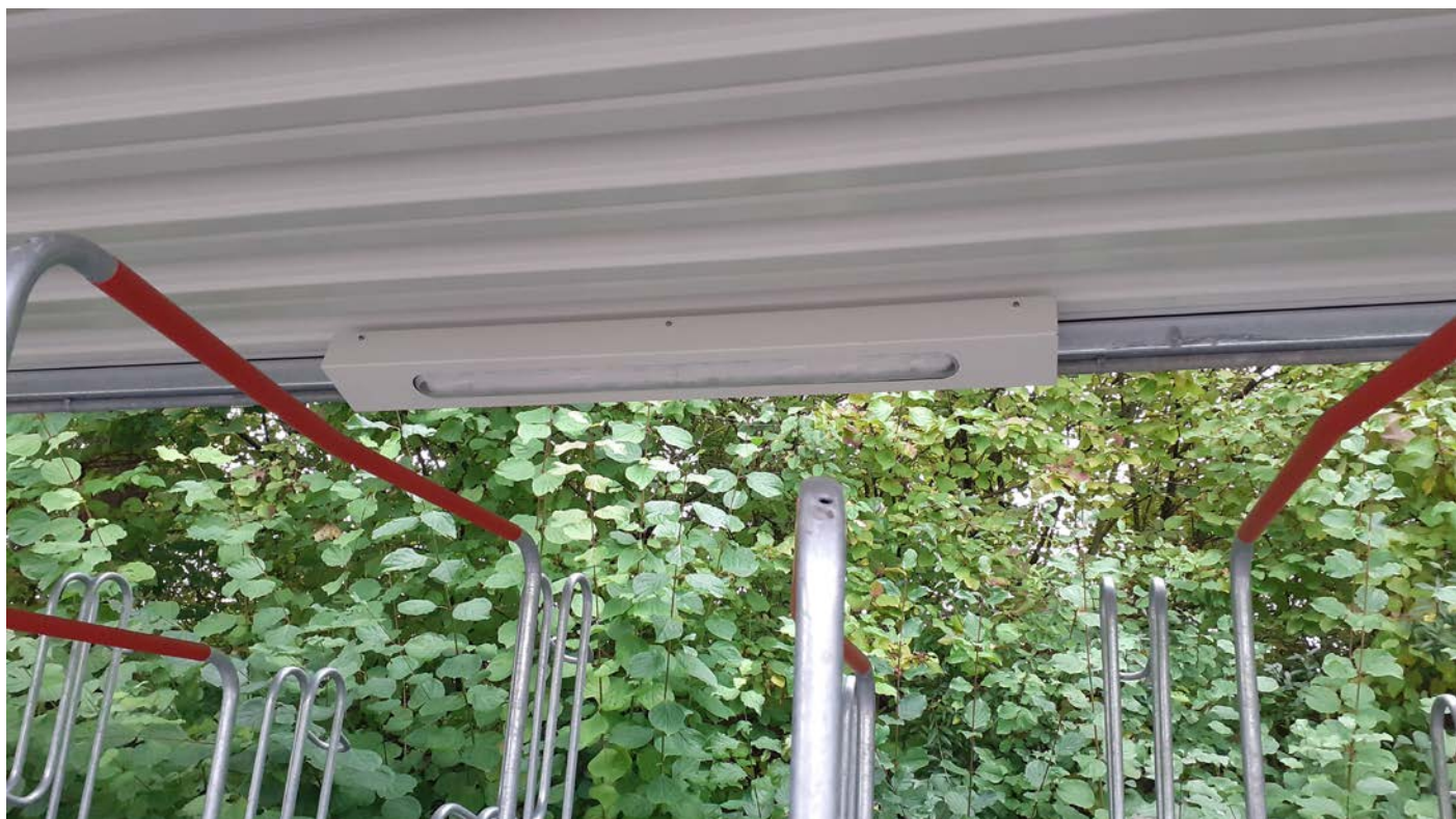
Beleuchtung / Radabstellanlage