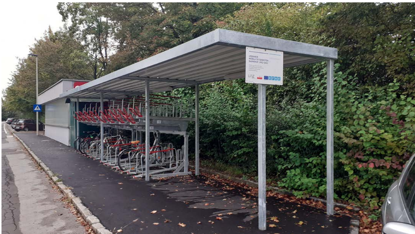
Überdachte Radabstellanlage mit Fundamentplatte und Beleuchtung