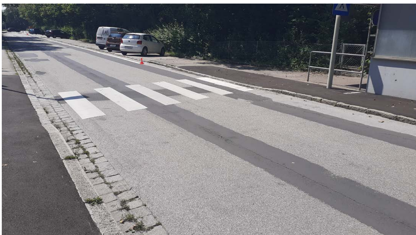
Schutzwegmarkierung inkl. Verbreiterung und Gehsteigabsenkung beim Übergang