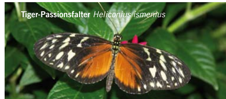
Tiger-Passionfalter Heliconius ismertus

Samstag, 31. Oktober 2009 - Sonntag 31. Jänner 2010: Flatterhaftes und Krabbeliges - Tropische Schmetterlinge und Vogelspinnen - Tropenhaus, Kakteenhaus