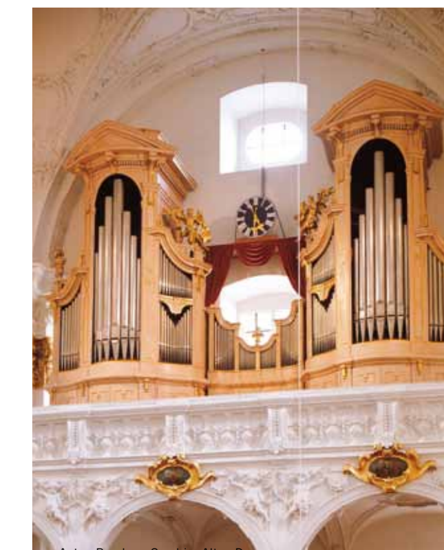
Anton Bruckner Orgel im Alten Dom. Anton Bruckner organ in the Old Cathedral.

Eine einzigartige Informationssammlung zu Leben und Werk bietet Ihnen das Anton Bruckner Institut. www.abil.at www.antonbruckner.at