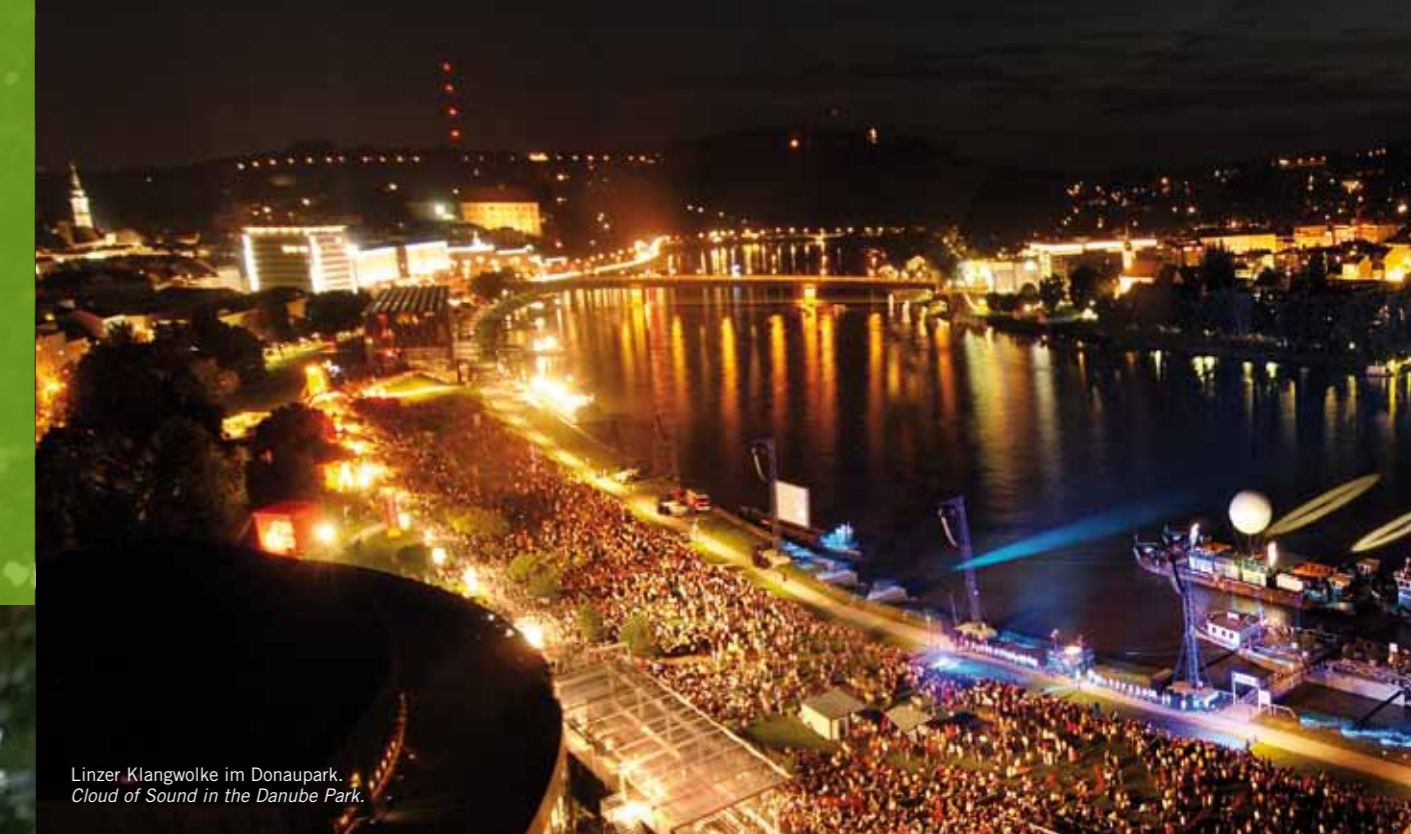
Linzer Klangwolke im Donaupark. Cloud of Sound in the Danube Park.