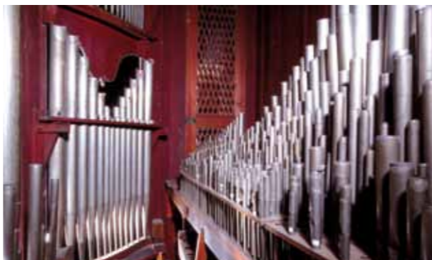
Ignatiuskirche (Old Cathedral), Domgasse 3, 4020 Linz www.brucknerstiege.at

The Old Cathedral was the second stage in Bruckner's career as a full-time organist. Having been modified to suit his wishes, the instrument still sounds like in Bruckner's days. This is also what makes it unique. The stairs of Brucknerstiege ascending to the organ are a lovely memorial to the great sound creator. Its display cases provide a clear and well-arranged introduction to Anton Bruckner, which is crowned by music played on the Bruckner Organ of St Florian. There are headphones available in the gallery.