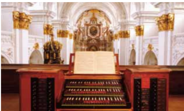
Ignatiuskirche (Alter Dom), Domgasse 3, 4020 Linz www.brucknerstiege.at

Der Alte Dom war Bruckners zweite Station als hauptberuflicher Organist. Das seinerzeit nach seinen Wünschen modifizierte Instrument klingt heute noch so wie zu Bruckners Zeiten. Das macht die Orgel auch einzigartig. Die zur Orgel empor führende Brucknerstiege ist eine reizvolle Gedenkstätte für den großen Tonschöpfer. Sie bietet in Schaukästen eine übersichtliche Einführung zu Anton Bruckner. Gekrönt wird sie von, auf der Linzer Bruckner Orgel gespielter, Musik. Dafür stehen Kopfhörer auf der Empore bereit.