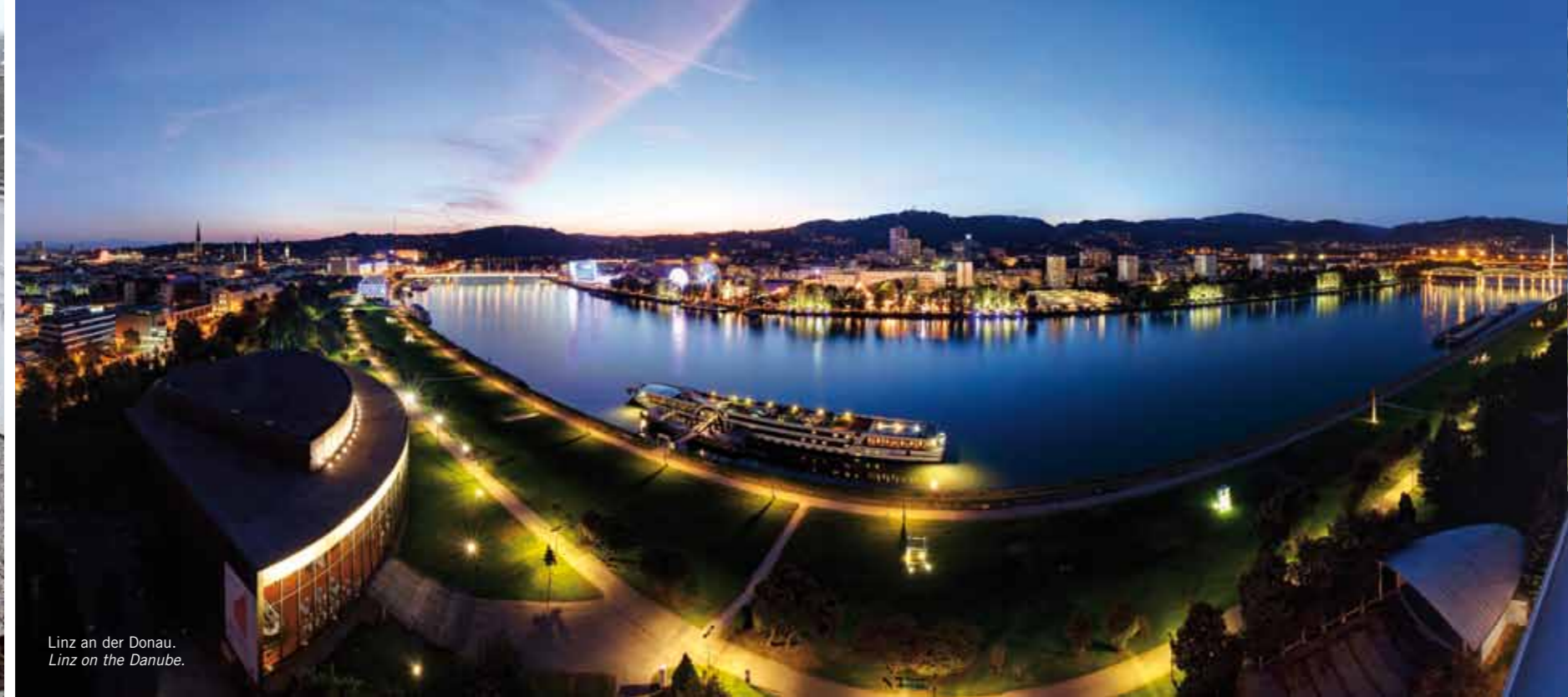
Linz an der Donau. Linz on the Danube.