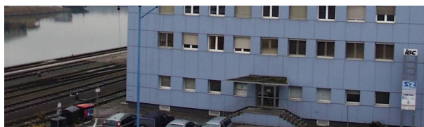
Linzer Hafen, Regensburgerstraße 9, 4020 Linz