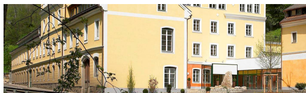
Lederfabrik, Leonfeldnerstraße 328, 4040 Linz