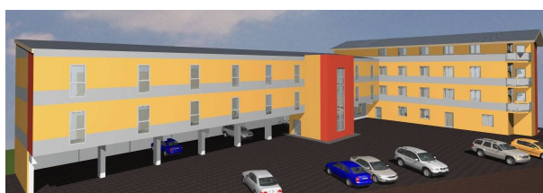
Q70 – Business Center, Sammelweisstraße 70a, 4020 Linz