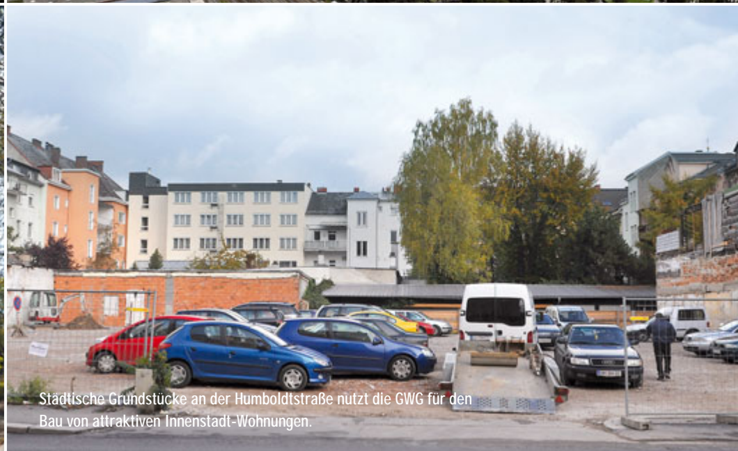
Städtische Grundstücke an der Humboldtstraße nutzt die GWG für den Bau von attraktiven Innenstadt-Wohnungen.