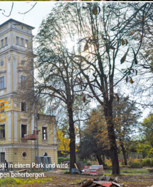
liegt in einem Park und wird beherbergen.