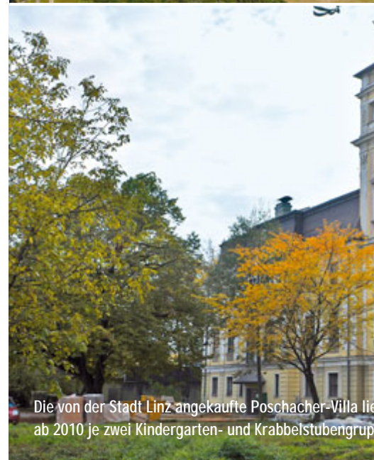
Die von der Stadt Linz angekaufte Poschachervilla wird ab 2010 je zwei Kindergarten- und Krabbelstubengruppen aufnehmen.