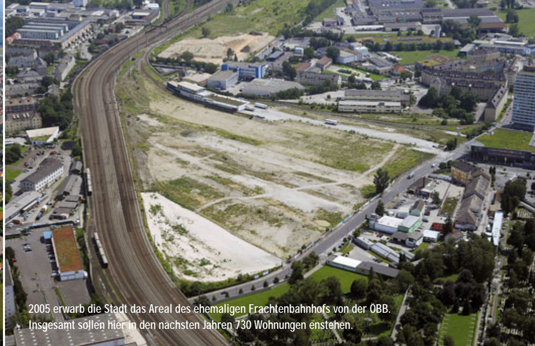
2005 erwarb die Stadt das Areal des ehemaligen Frachtenbahnhofs von der ÖBB. Insgesamt sollen hier in den nächsten Jahren 730 Wohnungen entstehen.