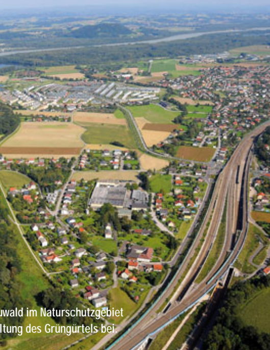
Wald im Naturschutzgebiet Entstehung des Grüngürtels bei