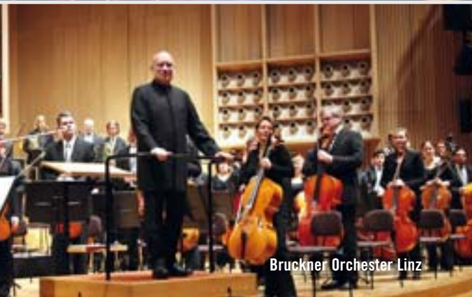
Bruckner Orchester Linz