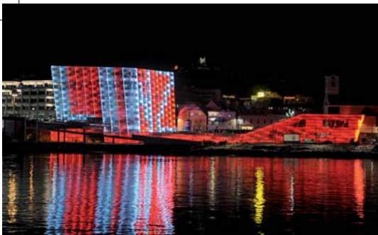
Ars Electronica Center