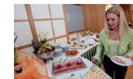
Hotel Kolping - Top Rad Stop in Linz