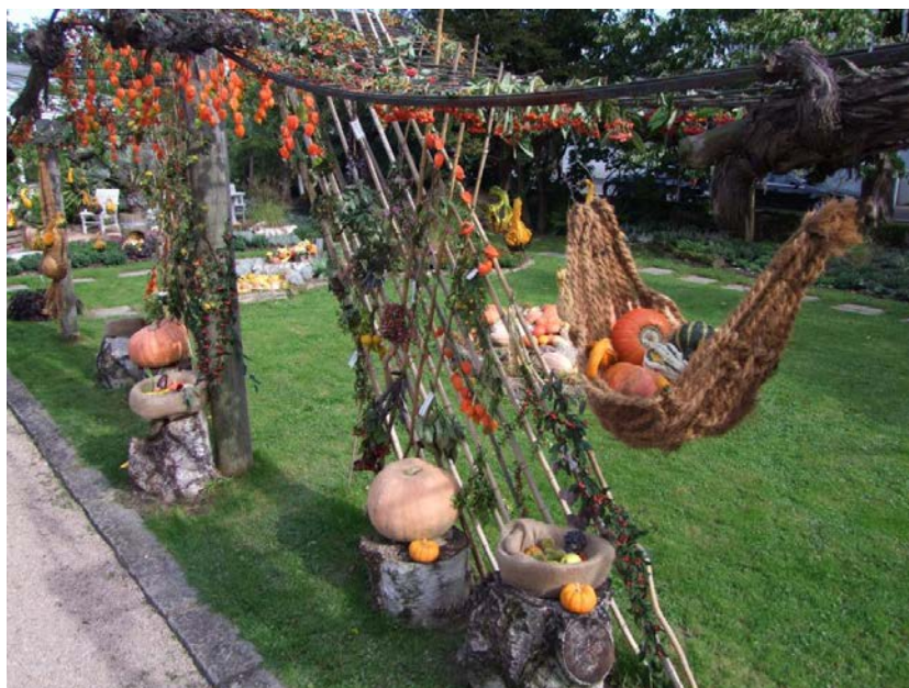
Herbstlicher Fruchtschmuck im Eingangsbereich

Bevor die Vegetation eine Pause einlegt und sich zur Winterruhe begibt, wartet sie im Herbst noch einmal mit einem überschwänglichen Farben- und Blütenrausch auf, der sich durchaus mit dem Sommer messen kann. Der Botanische Garten lädt Sie ein, an diesem prächtigen Schauspiel teilzuhaben: Vom 20. September bis 26. Oktober können Sie im Rahmen der traditionellen Herbstblumenschau noch einmal in Farben schwelgen. Das bunte Laub der Bäume leuchtet an sonnigen Tagen um die Wette mit vielfältigen Herbstblühern und schmückenden Blättern und Gräsern. Für bunte Blütenpracht sorgen die Chrysanthemen , die mit ca. 15 verschiedenen Sorten vertreten sind.