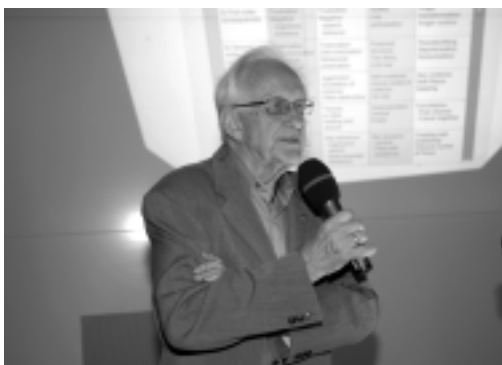
Dr. h.c. mult. Johan Galtung