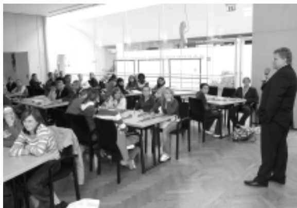
Stadtrat Klaus Luger mit den Teilnehmerinnen am Girls' Day

Auf dem Programm stand – neben einer Informationsveranstaltung über den Magistrat – das Ausprobieren und selbst-mit-Hand-Anlegen im jeweils gewählten Berufsbereich, Erfahrungsaustausch und Informationen durch das Linzer Frauenbüro sowie eine Feedback-Runde.