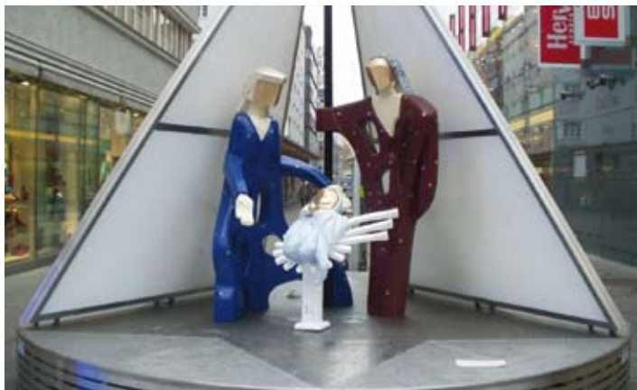
Großkrippe "Stern zu Bethlehem"