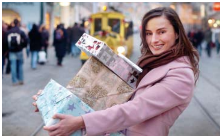
Weihnachtsshopping in Linz