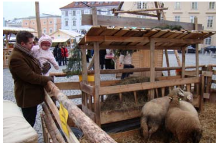
Streichelzoo am Pfarrplatz