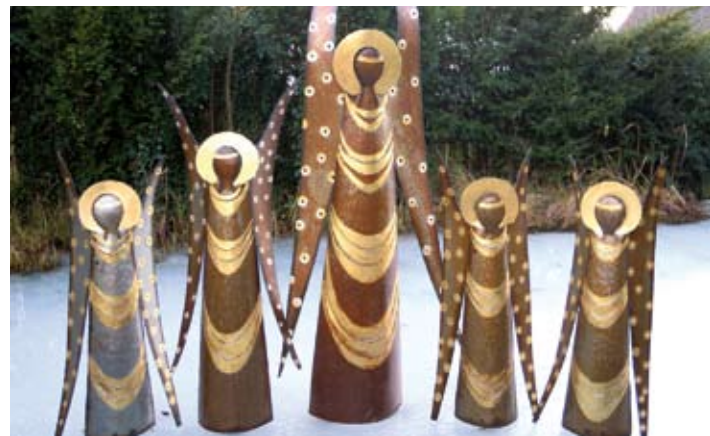
Lipp-Krippe im Botanischen Garten