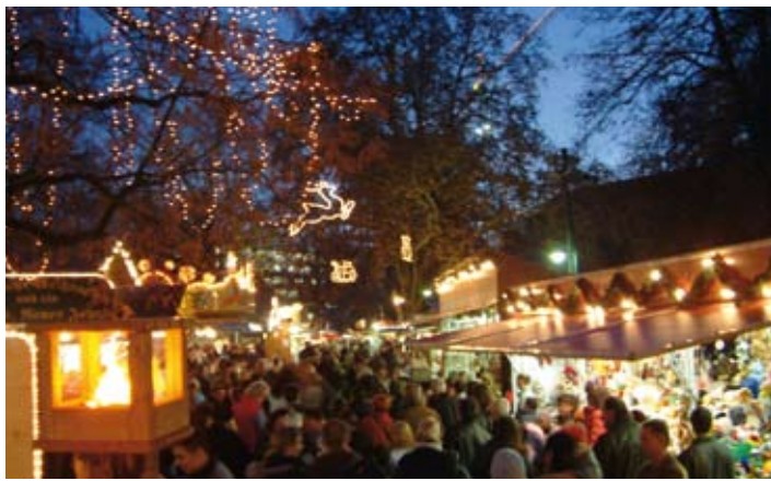
Weihnachtsmarkt im Linzer Volksgarten