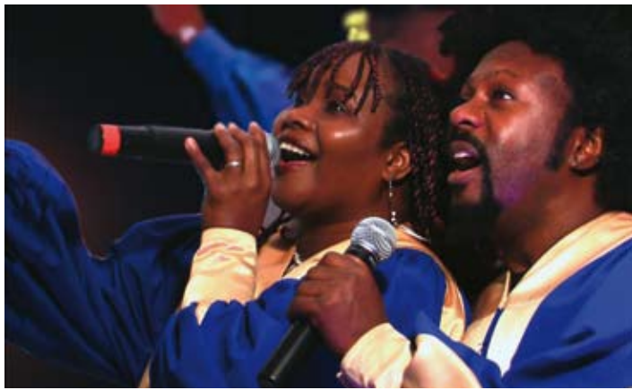
Kraft und Freude mit den Gospel Singers