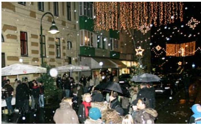
Adventmarkt in der Eisenhandstraße