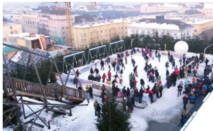
Eisbox am Dach des City-Parkhauses