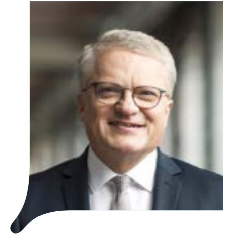
Bürgermeister Klaus Luger

Unsere Landeshauptstadt verzeichnet nach wie vor einen wahren Gründerboom: In Linz werden jedes Jahr bis zu 1.000 Unternehmen neu gegründet, das heißt, es öffnen täglich mehr als zwei neue Unternehmen ihre Pforten.