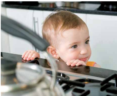
Kinder nicht unbeaufsichtigt in die Nähe des Herdes lassen!