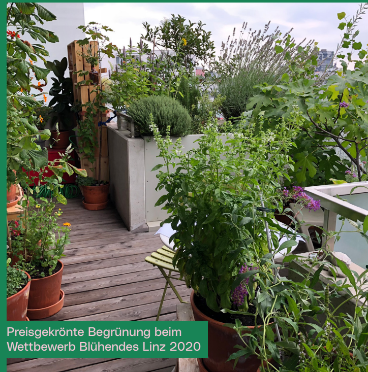
Preisgekrönte Begrünung beim Wettbewerb Blühendes Linz 2020