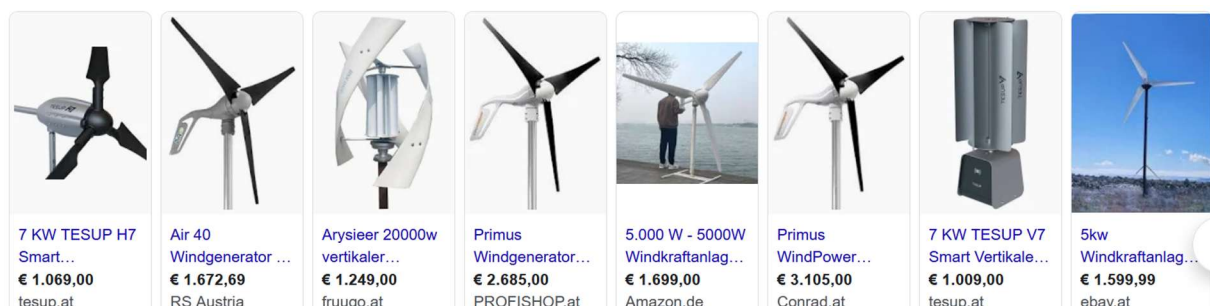
Abb. 1: Screenshot einer aktuellen Internetabfrage nach <10 KW Anlagen (Abfrage 7.12.2023)

Gegenüber den in der Studie angeführten Kosten zeigen viele Anlagen weit geringere Preise. Im Internet findet man tausende Anbieter – vor allem aus China, aber auch aus Indien, Kanada, USA, BRD, Holland, Dänemark, Italien, Ungarn, gelegentlich auch aus Österreich), wo Kleinst- bis Kleinanlagen ab einigen 100 W Nennleistung um wenige 100 (!) Euro (also billiger als „PV-Balkonkraftwerke“) online bestellt werden können und sich die Preise für Anlagen von <10 kW derzeit oft um 1000 Euro bewegen. Europäische Vertriebspartner von Überseefirmen – vor allem in Deutschland - werden immer mehr – und damit steigt auch das Sicherheitsempfinden bei Beratung, Kauf- und Service derartiger Anlagen.