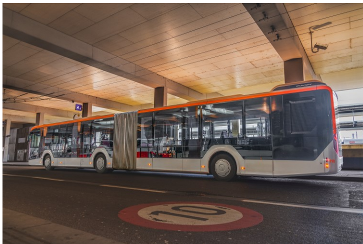
Bildtext: Die neue Schnellverbindung nutzt die Haltestelle Hauptbahnhof Terminal Steig A3

Während die bestehende Schnellbuslinie 72 über den „Hauptbahnhof-Kärntnerstraße“ verläuft, beginnt der neue Direktkurs 72* an der Haltestelle Hauptbahnhof Terminal Steig A3 . Dies bringt Vorteile für die einpendelnden Fahrgäste. Die Einstiegstelle Terminal Steig A3 ist auf kurzem Weg von den jeweiligen Ankunftsbahnsteigen zu erreichen. Der Fahrplan ist weitestgehend an relevante Ankunfts- bzw. Abfahrtszeiten (LILO, S-Bahnen, Regionalverkehr, ÖBB, Westbahn) angepasst.