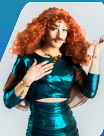
Bessy Mitch @ @bessy.mitch.drag