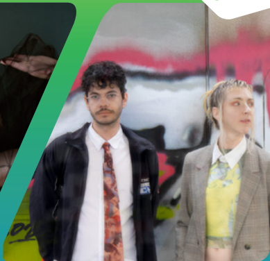
esti.d @ @3st1.d & dj(deletethis) vom @ @meduxacollective