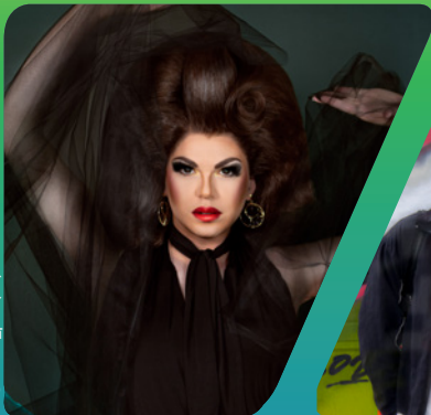
Mademoiselle Giselle mademoisellegiselle.com