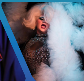
La Nonchalant @ @la.nonchalant