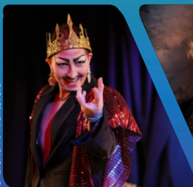
Prinz aus Linz @ @prinz.aus.linz