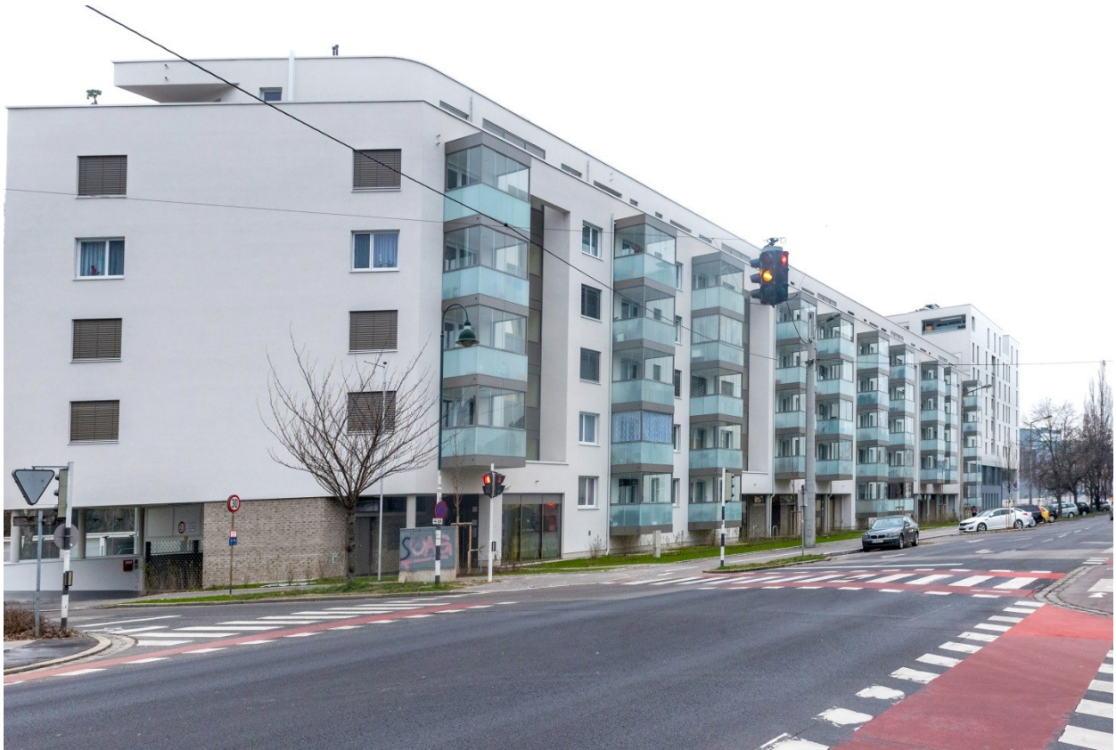
Die GWG errichtete in der Gürtelstraße mehr als 75 geförderte Mietwohnungen.