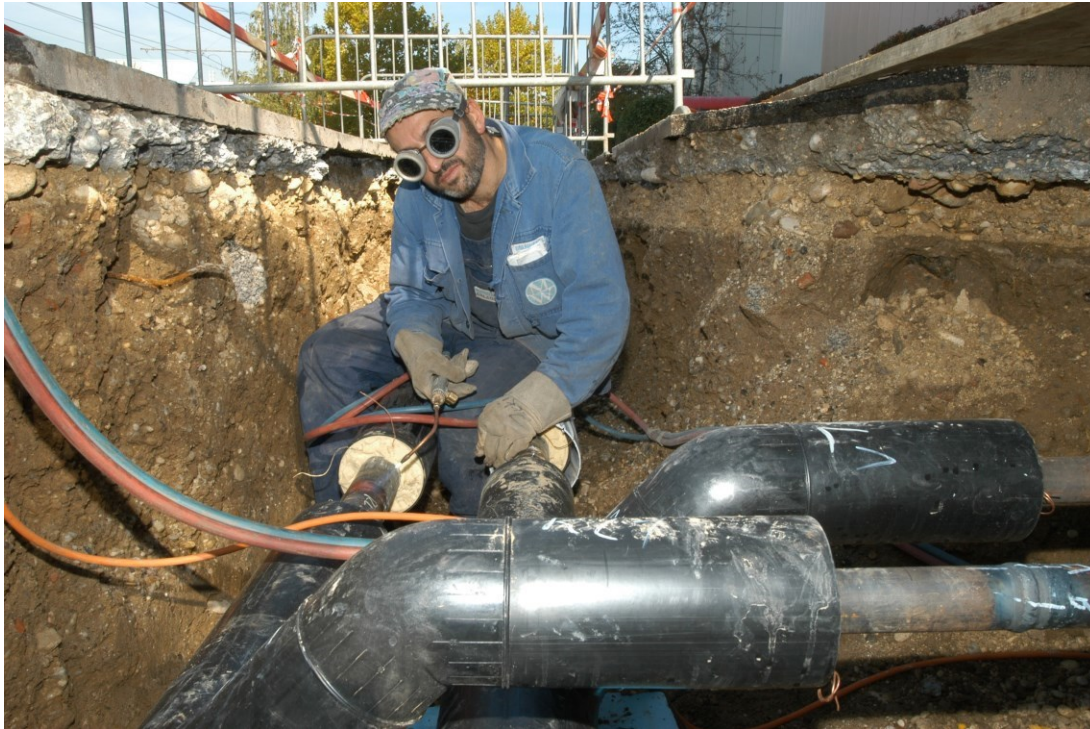
2016 investierte die LINZ AG 8,9 Mio. Euro in den Ausbau des Fernwärmenetzes