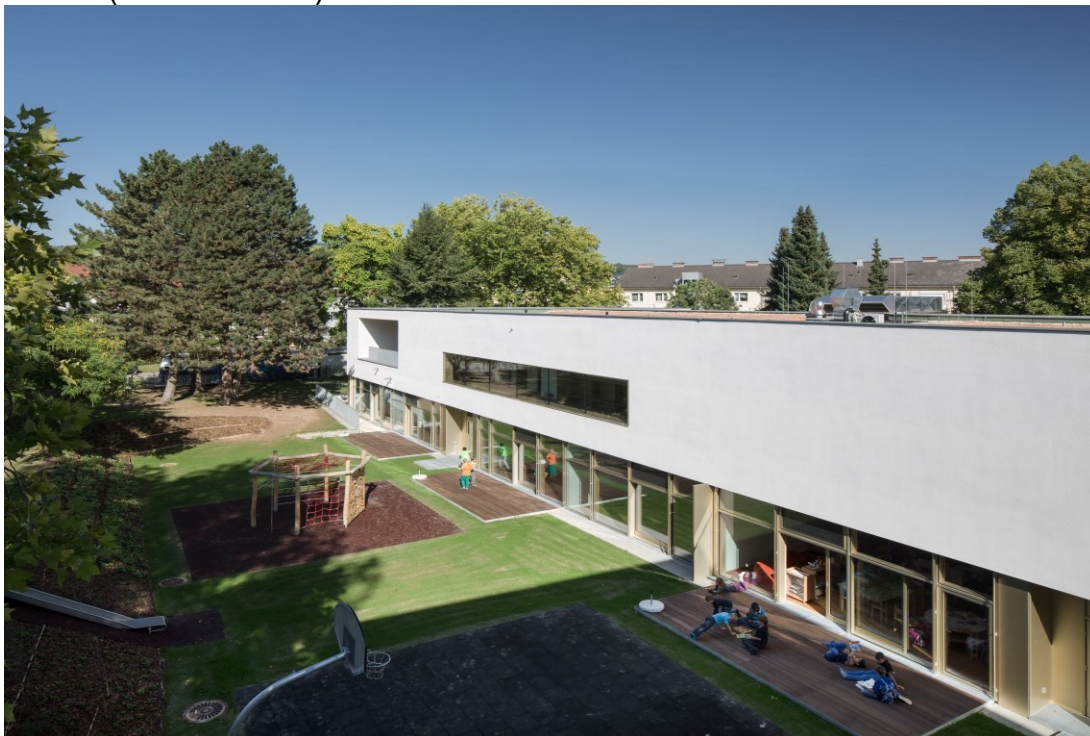
Krabbelstuben, Kindergärten und Horte sind für Familien besonders wichtig. Daher werden diese Einrichtungen laufend ausgebaut und modernisiert. 2016 wurden 5 Mio. investiert.